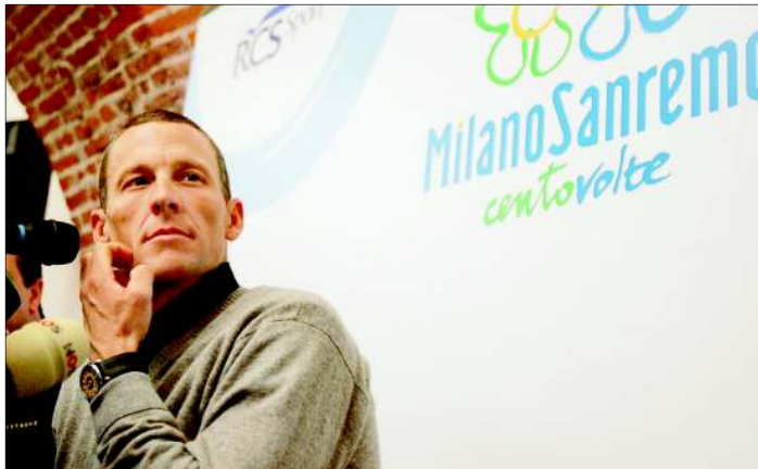
LANCE ARMSTRONG L'Américain n'a pas de grandes ambitions pour sa première course sur sol européen depuis 2005.

Mitrailé par les flashes des photographes, le Texan, vêtu d'une chemise noire et d'un pull gris, bras croisés, a répondu